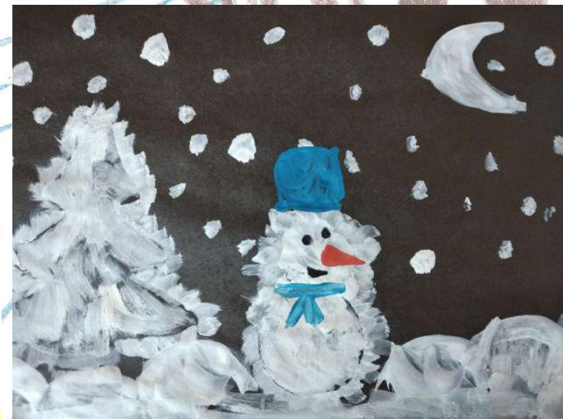
Ктрян Гаяне, группа №2