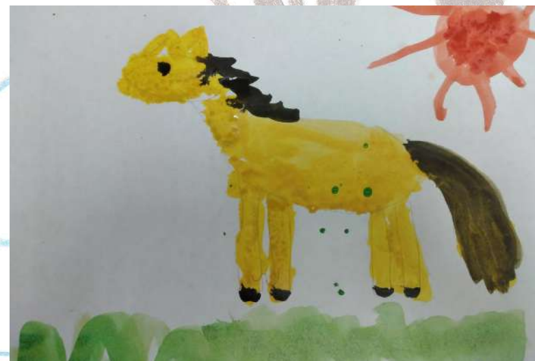
Елина София, группа №2